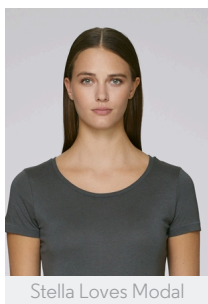
Stella Loves Modal